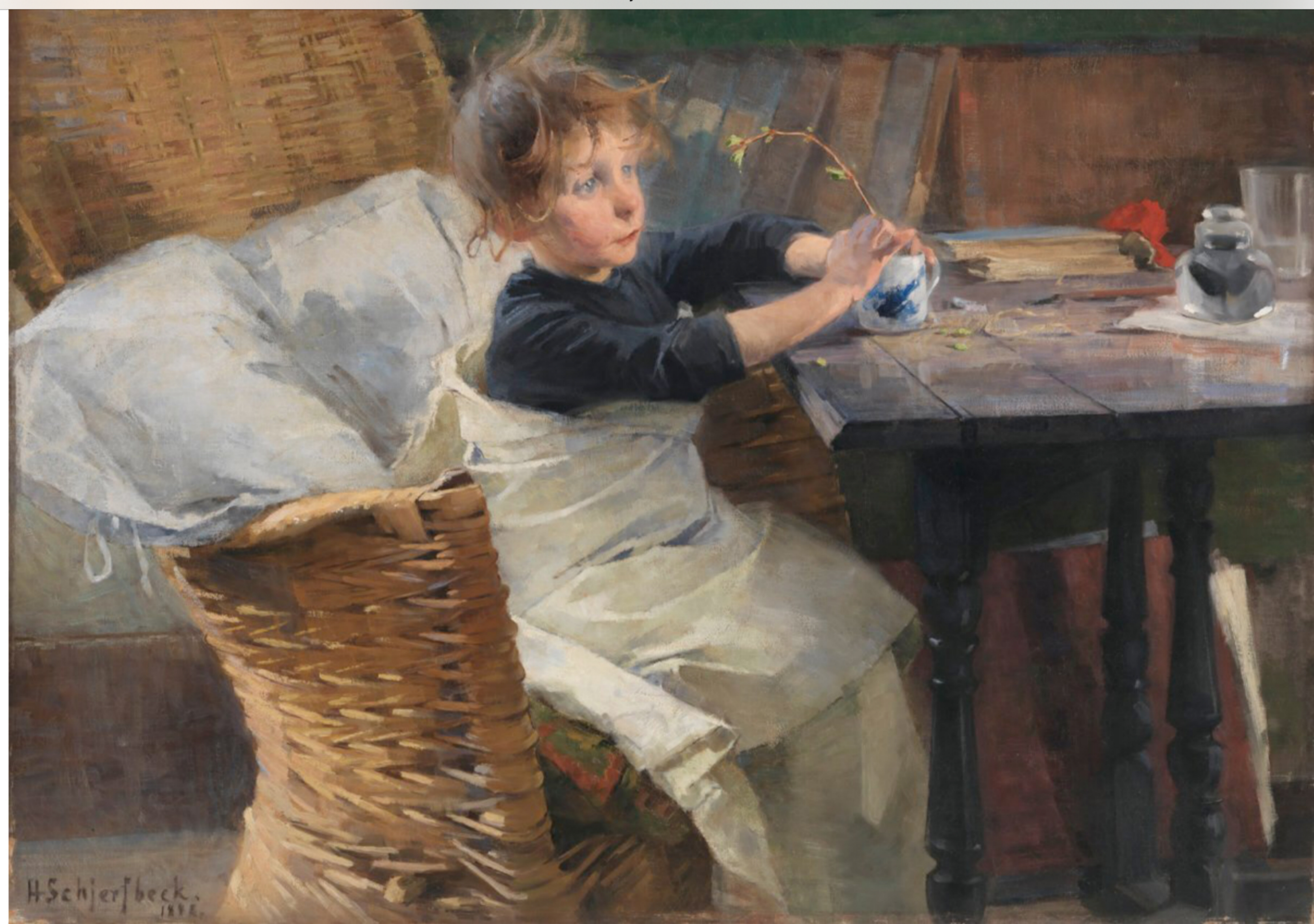
Toipilas, Helene Schjerfbeck 1888