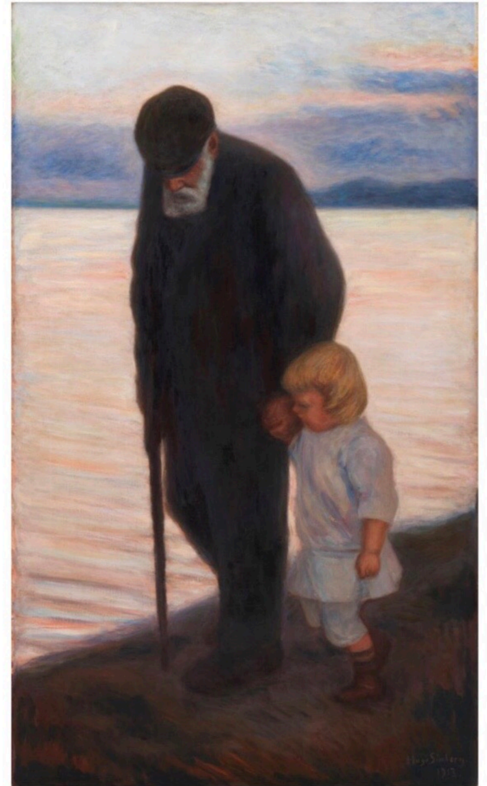
Iltaa kohti, Hugo Simberg 1913

Muistoja isän tai ukin lähellä vietetyistä turvallisista hetkistä