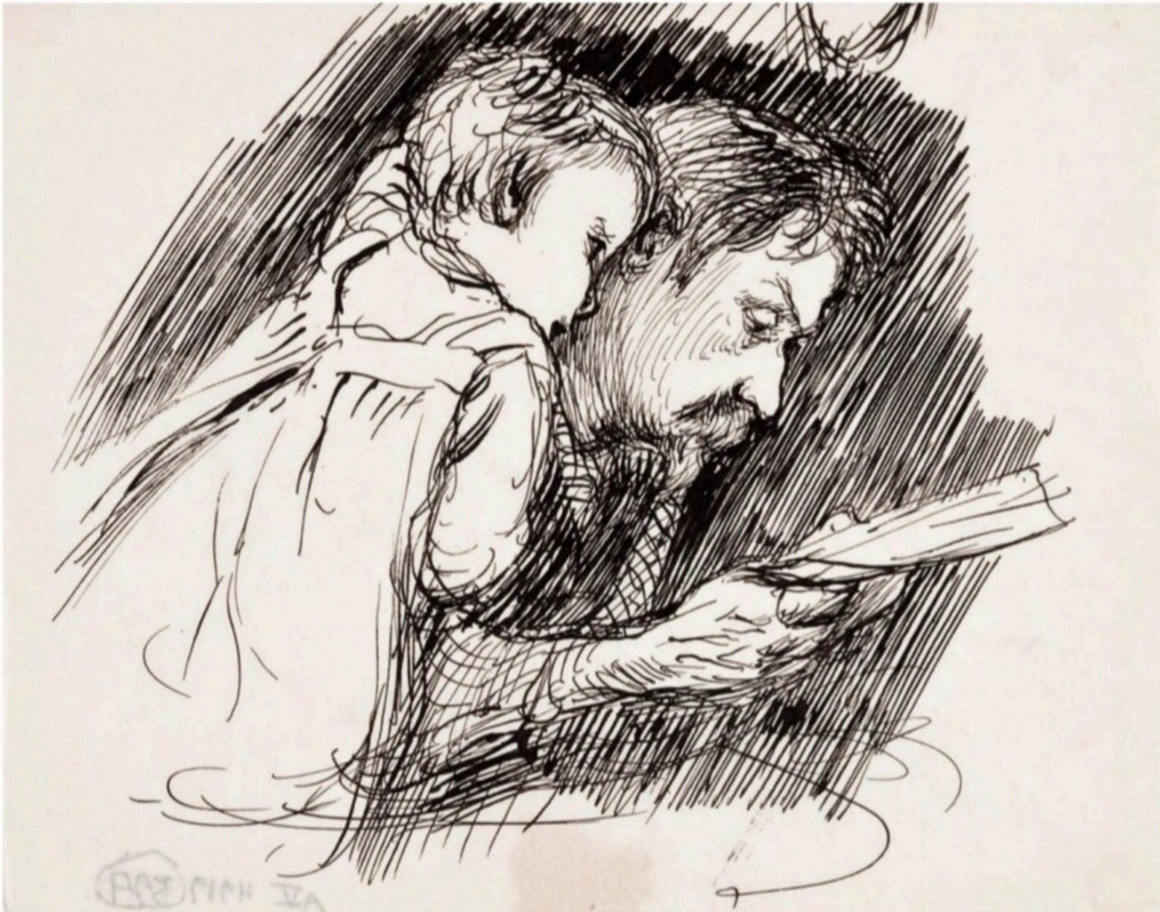
Isä lukee lapselle, Venny Soldan-Brofeldt

Muistoja isän tai ukin lähellä vietetyistä turvallisista hetkistä