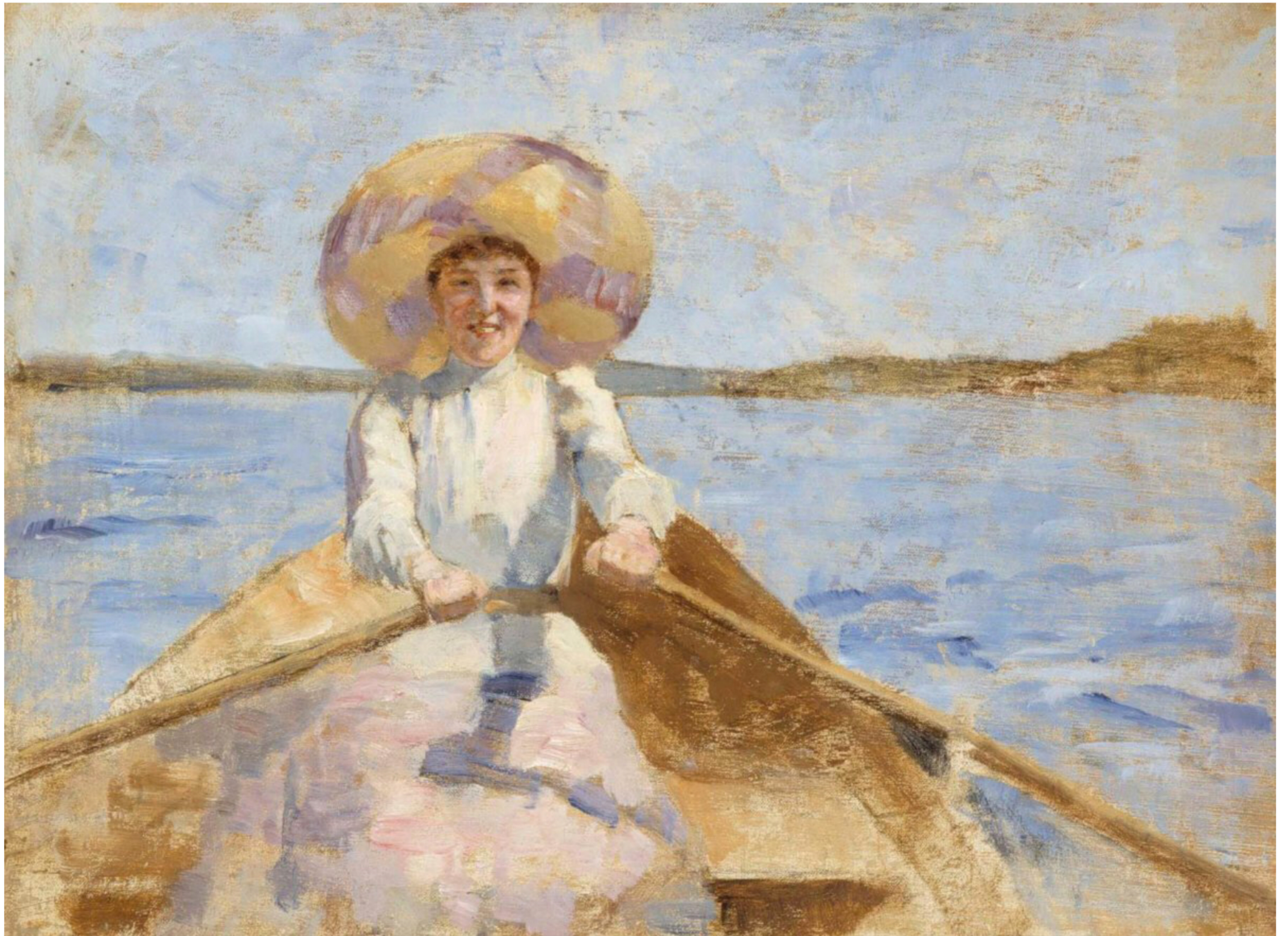
Soutava nainen (luonnos), Maria Wiik 1892